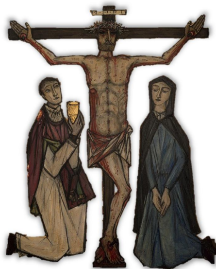
Chemin de croix d'Armand Niquille Eglise du Christ-Roi

(Prière d'ouverture, 1 er dimanche de Carême)